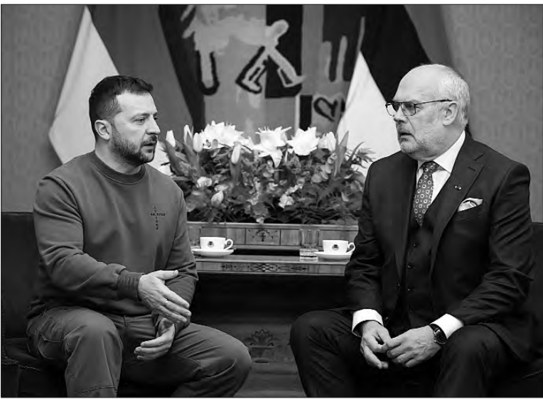
ПОЧАТОК НА 1-Й СТОР.

«Україна потребує більшого і кращого озброєння. Потужності військової промисловості ЄС необхідно збільшити, щоб Україна отримувала те, що їй потрібно, не завтра, а сьогодні. У нас не повинно бути жодних обмежень на постачання зброї Україні», — зазначив Алар Каріс. Він наголосив, що в Естонії є конкретні плани щодо відновлення України, для чого було б також справедливо використовувати заморожені російські кошти.