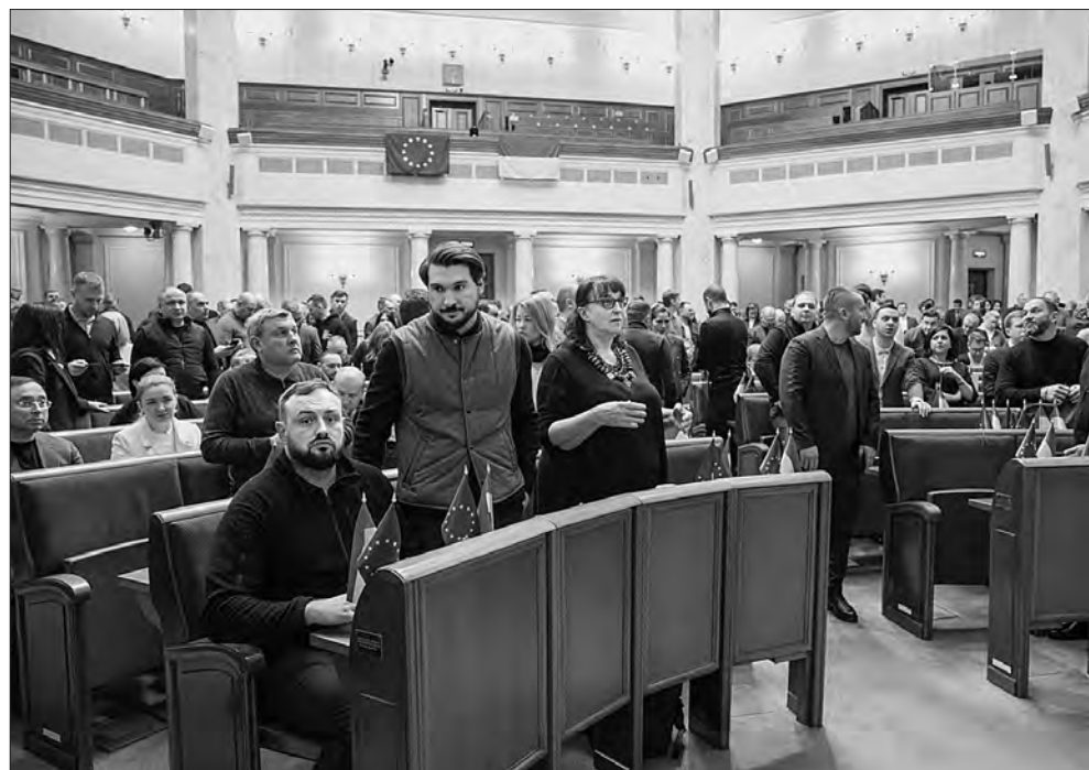
Під час засідання.

ло Гетманцев, ці зміни мають переважно юридично-технічний характер. Вони полегшують реалізацію функцій Фонду. Зокрема, закон визначає чіткий механізм черговості задоволення вимог вкладників та інших кредиторів щодо банків, де триває процедура ліквідації. Врегулює питання, коли виконавець державного оборонного замовлення має