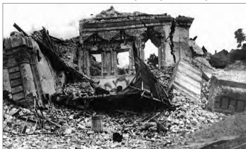
Руїни собору Михайлівського Золотоверхого монастиря після підриву 14 серпня 1937 року.

У січні 1934 року XII з'їзд КП(б)У ухвалив перенести столи-