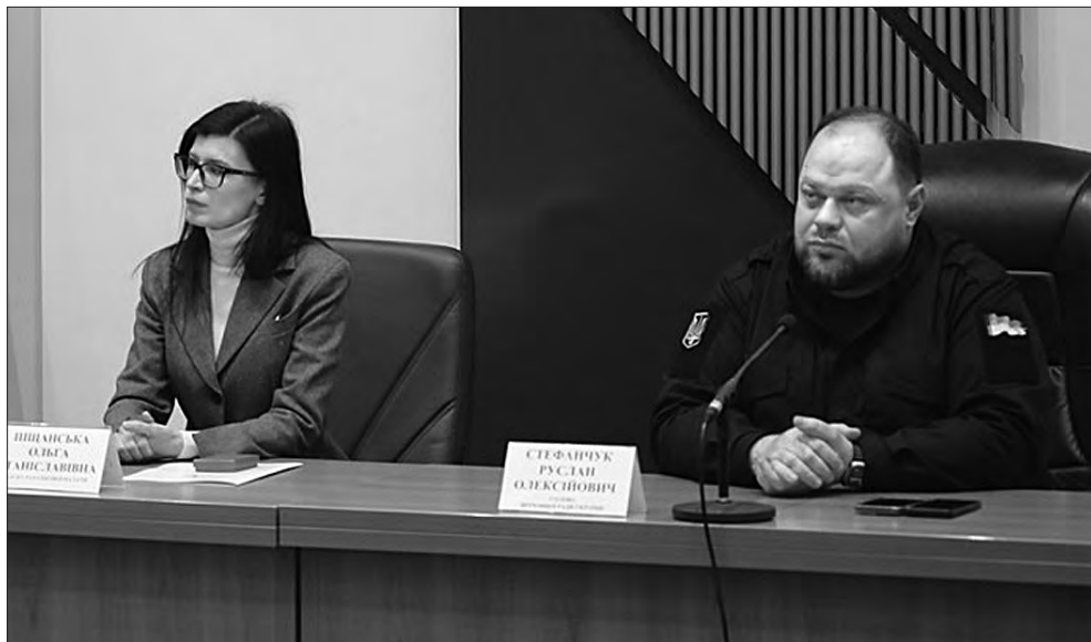
Фото з сайту Рахункової палати.

Прес-служба Апарату Верховної Ради України.