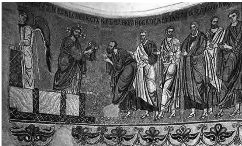
Частину старовинних мозаїк вдалося врятувати.